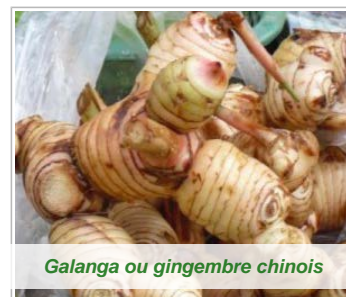
Galanga ou gingembre chinois