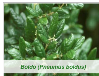
Boldo (Pneumus boldus)

Les activités biologiques de la gelée royale sont dues à la richesse en nutriments et leur action synergique efficace. Parmi ceux-ci, particulièrement significative est la présence d' acide pantothénique ou vitamine B5 , considéré comme le principal responsable des effets de la gelée royale sur la longévité de la reine des abeilles. Les propriétés toniques et revitalisantes sont soutenues par la présence de substances à action stimulante sur le fonctionnement des glandes internes, en particulier les glandes surrénales , les ovaires et les testicules. Au niveau pédiatrique, des recherches documentées tendent à prouver comment la prise de gelée royale influe assurément avec le gain de poids, la normalisation des processus de digestion, une meilleure récupération en présence de malnutrition. Des