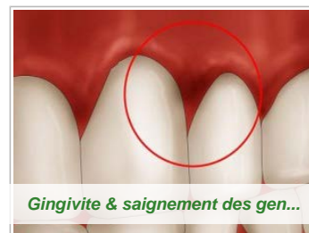
Gingivite & saignement des gen...

Le principal intérêt que revêt la gelée royale, pour les humains, réside dans sa propriété revitalisante exceptionnelle. Son usage est particulièrement adapté chez les personnes âgées et les petits enfants. Ceci étant, les sportifs, les