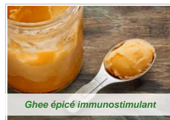
Ghee épice immunostimulant