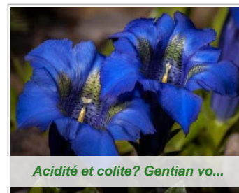
Acidité et colite? Gentian vo...